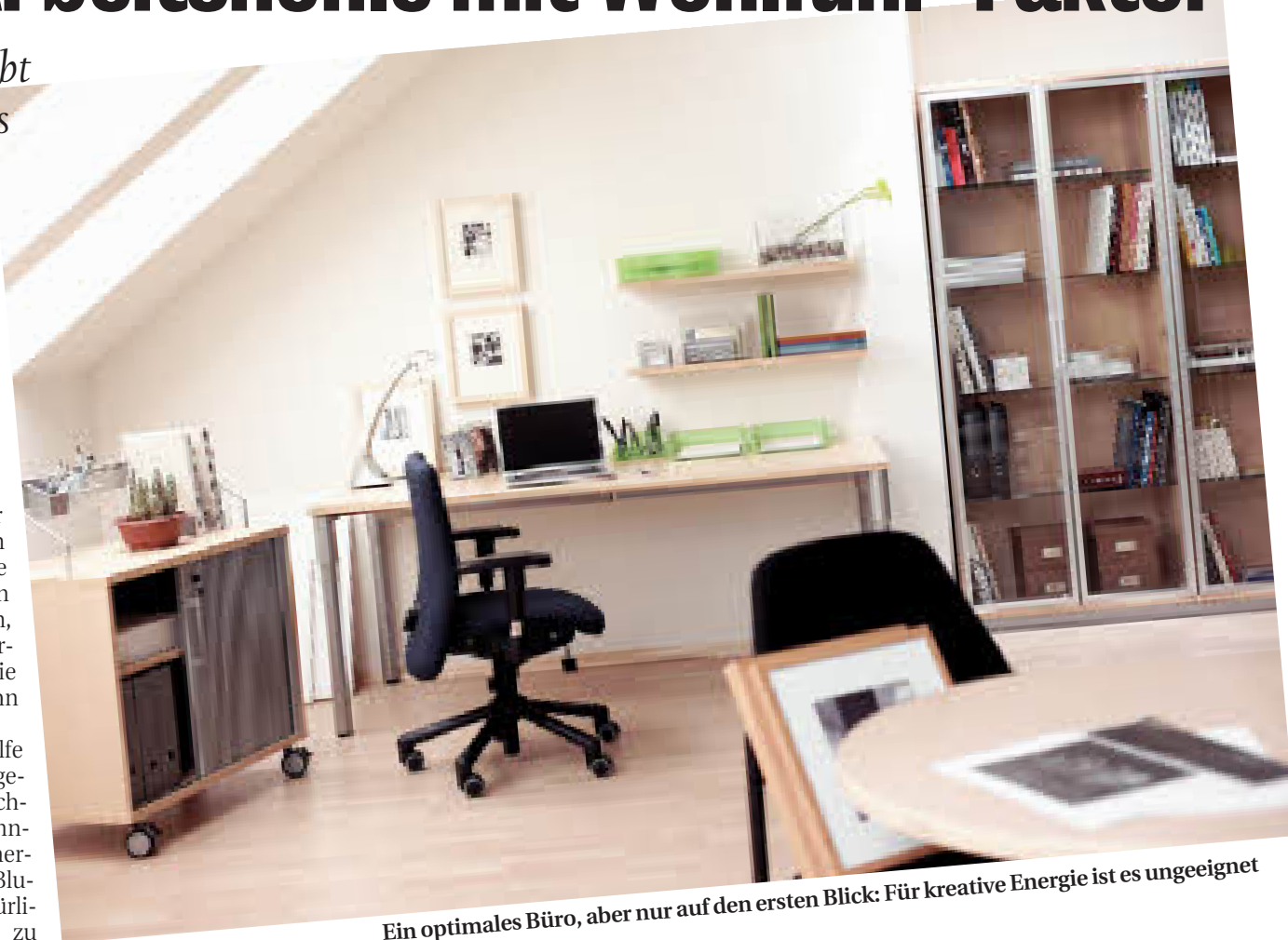
Ein optimales Büro, aber nur auf den ersten Blick: Für kreative Energie ist es ungeeignet